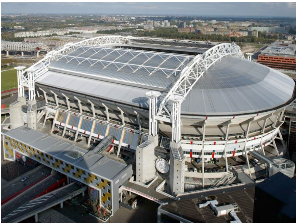
Bild 2: Dach der Amsterdam Arena, bestehend aus Lexan solar control IR® [Sabic Innovative Plastic]